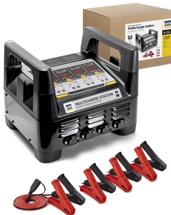
Câbles déconnectables 1.5 m