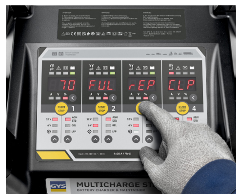
Écran digital pour chaque sortie